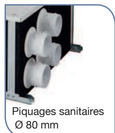
Piquages sanitaires Ø 80 mm