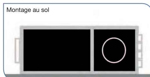
Montage au sol