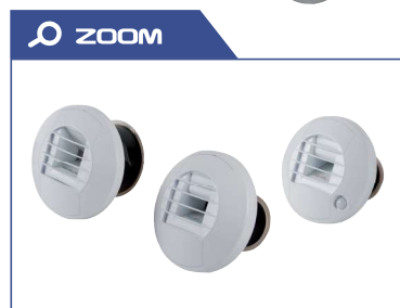
Bouches incluses dans les kits page 50.